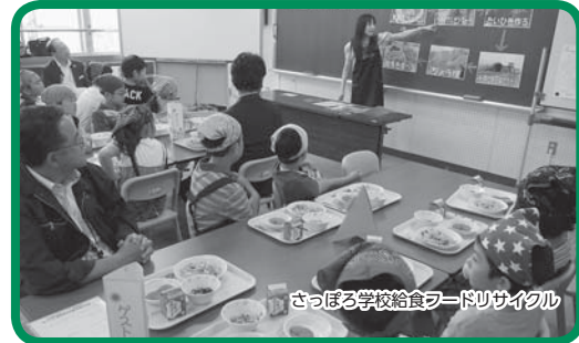
さっぽろ学校給食フードリサイクル

「さっぽろ学校給食フードリサイクル」は、学校給食の調理くずや食べ残しなどの生ごみを堆肥化し、その堆肥を利用した作物を給食の食材にする取り組みです。この取り組みを通じて食べ物を大切にする心を育てています。