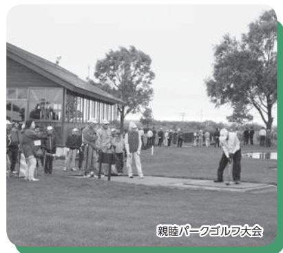
親睦パークゴルフ大会