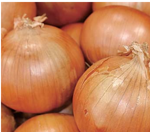
タマネギ 販売期間：8月～3月