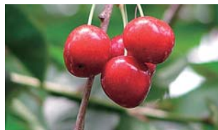
果樹 イチゴ・サクランボ・ブルーベリー・ プラム・プルーン・ブドウ・リンゴ・ ナシ 販売期間：6月～10月