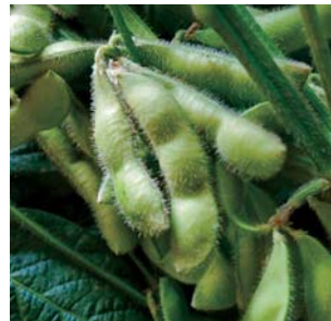
サップロミドリ（エダマメ） 収穫時期：8月上旬～9月初旬