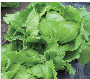
レタス 販売期間：6月～10月