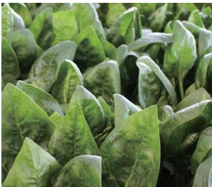
ほうれん草 ポーラスター 販売期間：6月～10月