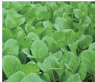
小松菜 販売期間：5月～10月