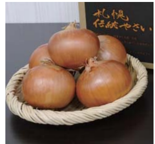
札幌黄（タマネギ） 収穫時期：9月初旬