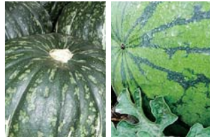
カボチャ 大浜みやこ スイカ サップロスイカ 販売期間：7月～9月