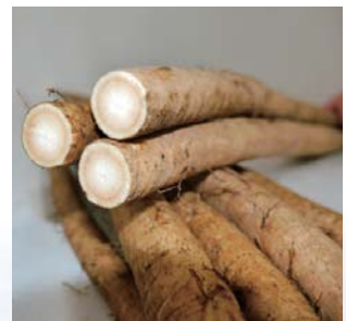
札幌白ゴボウ 収穫時期：9月下旬～11月上旬