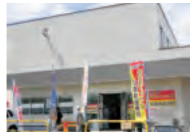
とれたてっこ南生産者直売所