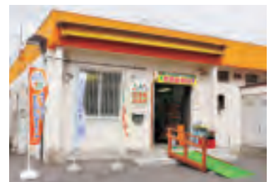
東経済センター 厚別直売所

札幌市厚別区厚別中央5条3丁目1-6 ◎月～金曜 9:00～17:00 ※農産物販売は16:00まで