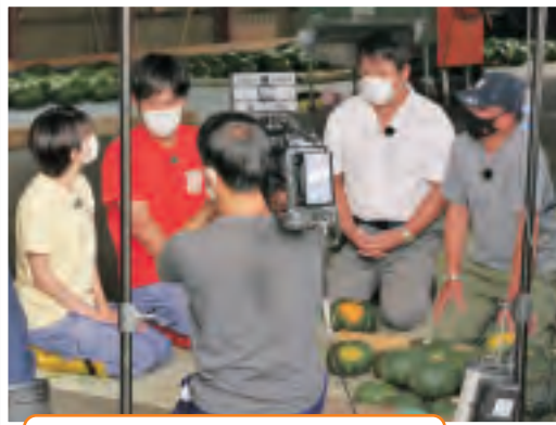
新型コロナウイルス感染拡大防止のため、マスクをしながらの撮影となりました。