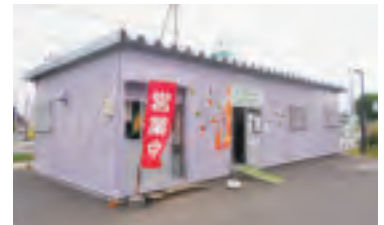
しのろとれたてっこ 生産者直売所