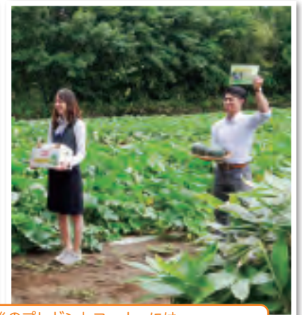
番組最後のプレゼントコーナーには、手稲支店・西経済センターの職員も出演しました。