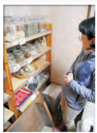
△商品は量り売りにして、 プラスチックゴミを減らす努力も。

「僕らがしている農業は、いわゆる『生産者』とは少し違いかも知れませんが、『子どもたちの未来のために』が活動のテーマ。農業を母体として地域を盛り上げたり、雇用を生んだり、幅広くできることをどんどんやっていきたいです」