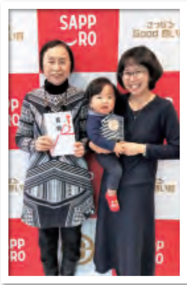
△市役所で行われたさっぽろGood 商い賞の授賞式には、ひろみさんと 幸江さんが参加。