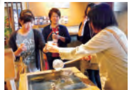
▲「千歳鶴」の命である、仕込水を試飲。

昼食は同じ敷地内にあるファームレストラン「食祭」にて、有機野菜を使ったランチ。アトリ工陶で作られた食器が使われており、「こういうお皿を作ればよかった～」「作るのが難しそうなグラス！」と陶芸を体験した直後とあって、食器も楽しみながらの昼食となりました。