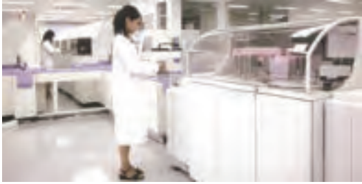
感染症・生化学検査