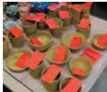
▲今回作った作品は焼きあがりを持って、次の講座で配られる予定です。楽しみ～！

工場見学では、札幌市内にある「千歳鶴酒ミュージアム」と「雪印メグミルク工場」を訪れました。千歳鶴酒ミュージアムでは歴史ある醸造所で酒造りの工程を学び、「千歳鶴」の試飲や酒かすソフトクリームなどを楽しみました。雪印メグミルク工場では、一日に200mlの牛乳を平均70万個も製造しており、全て積み上げると東京スカイツリー100基分にもなるとのこと。受講生からも驚きの声があがっていました。