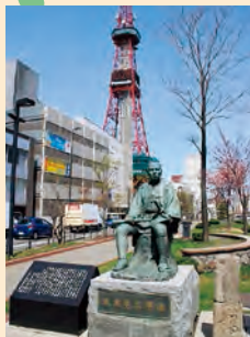
大友亀太郎 像 (創成川公園 南1条)