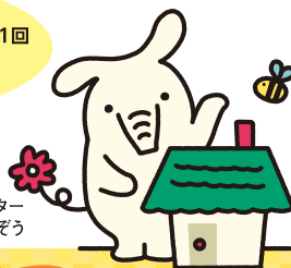
JAバンクキャラクター ©よりぞう

取扱期間中にあんしんステップを 新規ご利用いただいた皆様に、お借入後3年間、年に1回 農産物をプレゼント! 詳しくは窓口までお問い合わせください。